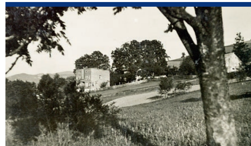
Willa w Śleszowicach