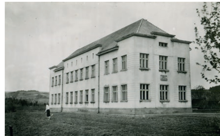
Szkoła w Zembrzycach