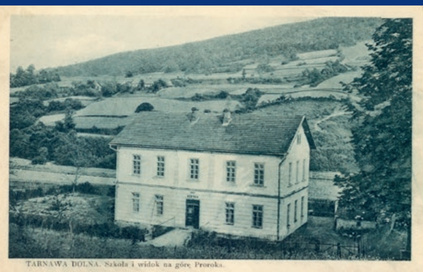
Szkoła w Tarnawie Dolnej