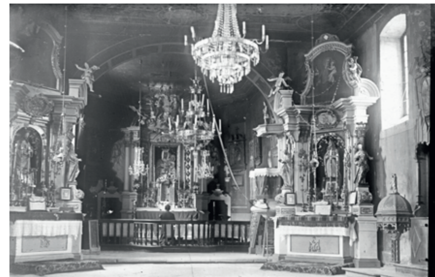
Kościół w Tarnawie Dolnej

rzowe neogotyckie, z czasu budowy kościoła. Ołtarz główny z obrazem patrona Św. Jana Kantego. Zadanie to realizowane będzie w formie wsparcia finansowego dla parafii w Tarnawie Dolnej w planowanej wysokości 210 000 zł i obejmować będzie prace konserwatorskie przy polichromii